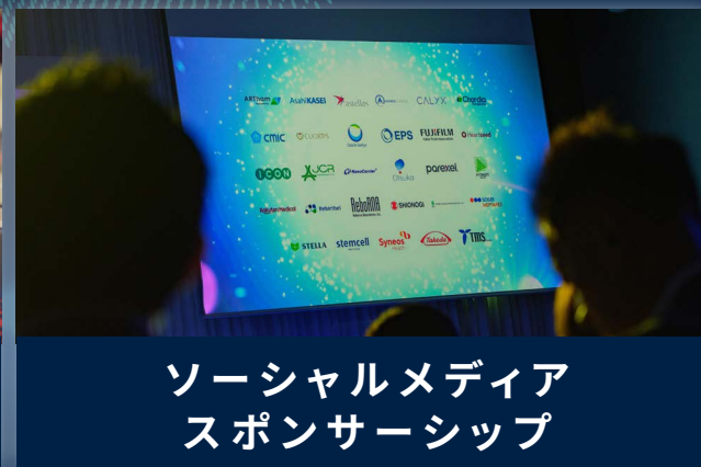
ソーシャルメディア スポンサーシップ