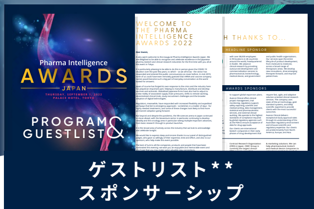
ゲストリスト** スポンサーシップ