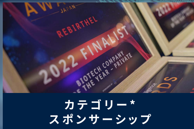
カテゴリー* スポンサーシップ