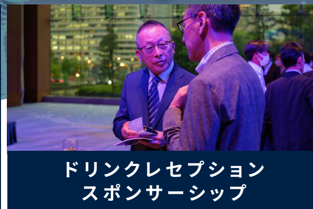
ドリンクレセプション スポンサーシップ

★ご要望に個別に対応するビスポーク型スポンサーシップもご提供可能です。お気軽にご相談下さい。