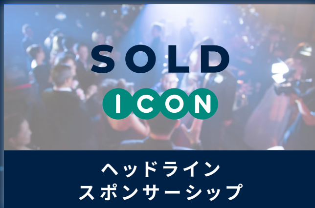
ヘッドライン スポンサーシップ